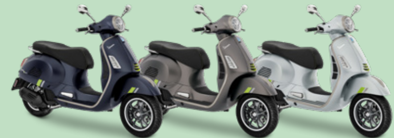
BLAU ENERGICO MATT